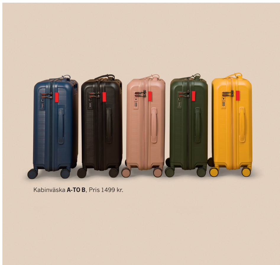
Kabinväska A-TO B, Pris 1499 kr.

Enligt min åsikt finns det en annan anledning att inte ha för stor exponering mot OMX30 index och cykliska aktier. Den globala tillväxten är idag mycket lägre än den har varit historiskt och den kommer nog fortsätta att vara så framöver på grund av åldrande befolkning och minskad produktivitet. Försäljningen hos de flesta cykliska bolag växer i nivå med BNP-tillväxten, även om det går upp och ner i cykler. Genom att istället investera i bolag som växer i snitt mer än BNP kommer aktiekursen i dessa bolag att över tid slå borsindex. Därför tycker jag att man, istället för OMX30, ska äga en portfölj av utvalda rimligt värderade bolag. Leta efter teman med hög långsiktig tillväxt som vattenförsörjning, digitala betalningar, det uppkopplade hemmet, urbanisering och långt liv. På så sätt behöver du inte bekymra dig om vilken cykel konjunkturen är i – och värdet på din portfölj kommer förhoppningsvis bara att ticka på.